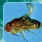
ショウジョウバエ