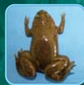
ネッタイツメガエル