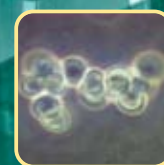
研究用ヒト臍帯血細胞