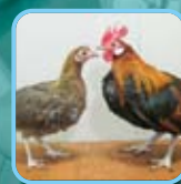
ニワトリ・ウズラ