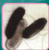
原核生物 (大腸菌・枯草菌)