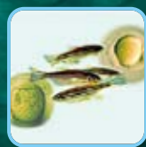
ゼブラフィッシュ