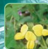
スヤクサ・タイズ